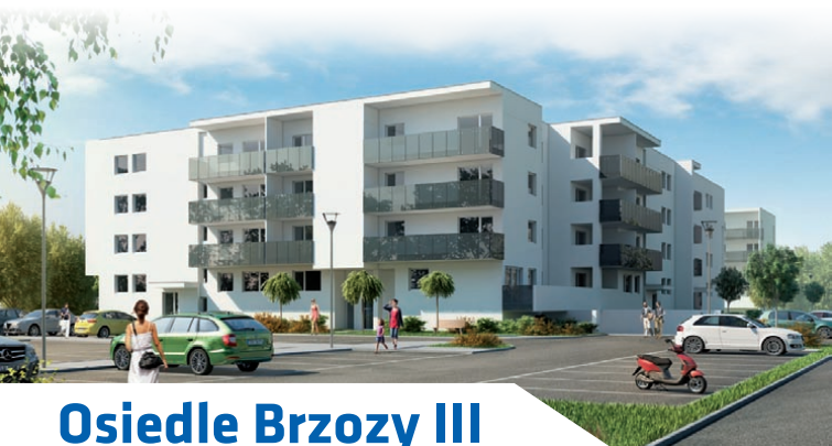
Osiedle Brzozy III