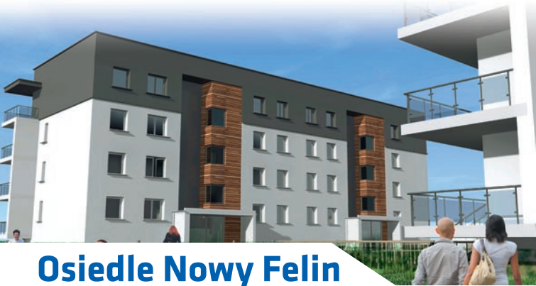
Osiedle Nowy Felin